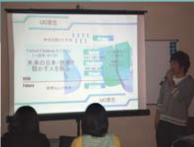
↑プレゼンテーションに挑むメンバー