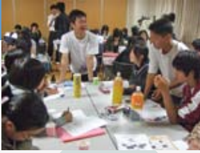
↑自分達ができることを話し合う

UnitedChildren (以下UC)は、2001年、静岡県浜松市の4人の中学生(当時:浜松市立中部中学校2年)が立ち上げた団体です。まちづくりイベントの企画、清掃活動など、地域社会の為に自分たちが出来ることを考え、企画・実行・振り返りのすべてを中高生を中心としたメンバー自身の手で行っています。そしてその活動で地域に貢献すると共に、自らも素晴らしい未来を創り出せる人間に成長することを目的としています。